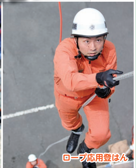
ロープ応用登はん