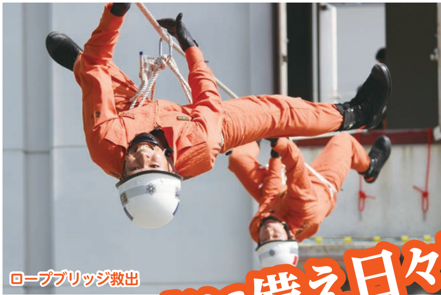
ロープブリッジ救出