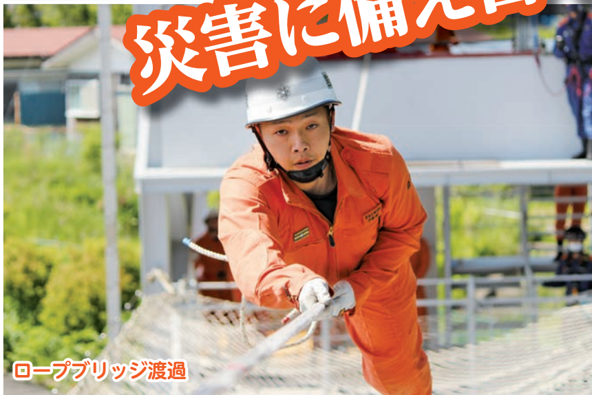
ロープブリッジ渡過