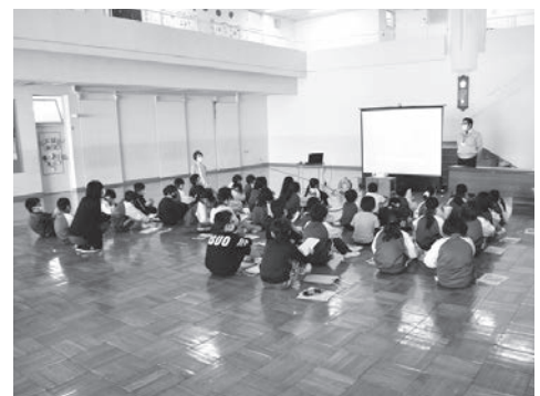
小学校出前講座の様子