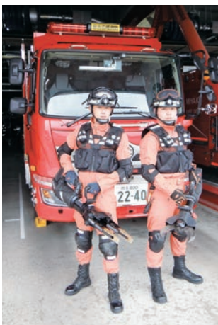
新たにバッテリー式の油圧救助器具を採用。交通事故等での活動に使用します。

宮古消防署の救助工作車が15年ぶりに更新されました。救助工作車は交通事故や自然災害等の現場に出動し、主に人命救助活動を行う特別救助隊が運用する車両です。最新装備を搭載し、今年3月から運用を開始しています。 また、緊急消防援助隊にも登録されており、大規模災害等が発生した際には、全国各地に災害派遣出動し活動します。